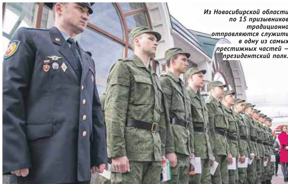
Из Новосибирской области по 15 призывников традиционно отправляются служить в одну из самых престижных частей — президентский полк.