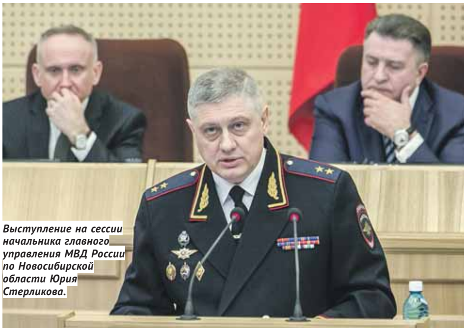
Выступление на сессии начальника главного управления МВД России по Новосибирской области Юрия Стерликова.

Общее число нераскрытых преступлений сократилось на 12%, больше стали раскрываться убийства, причинения тяжкого вреда здоровью, разбои и мошенничества. Было раскрыто 806 преступлений прошлых лет, в том числе 248 тяжких и особо тяжких. С тем, что стало больше уделяться внимания профилактике, Юрий Стерликов связал снижение числа преступлений, совершённых в состоянии алкогольного опья-