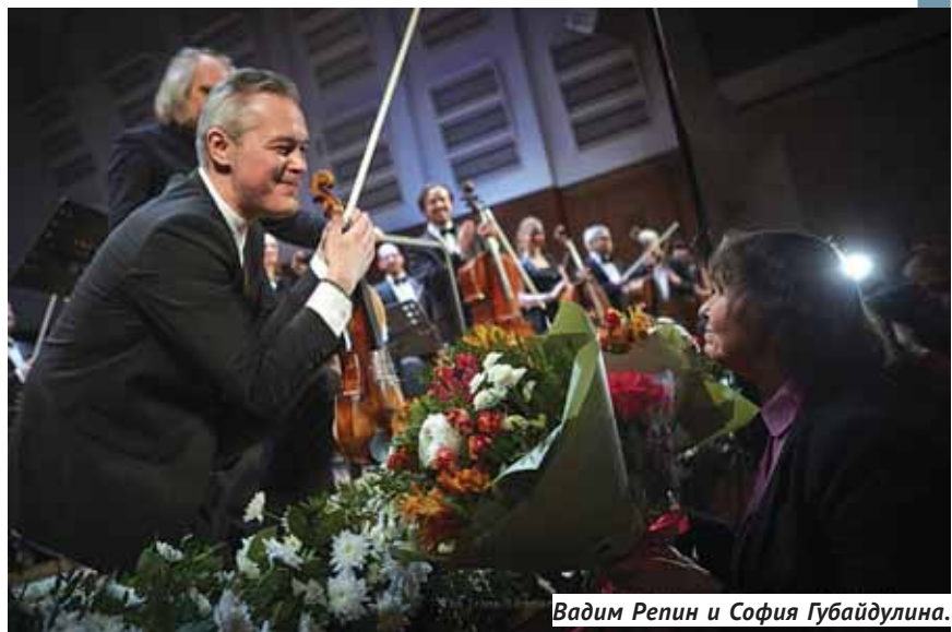
Вадим Репин и София Губайдулина.

В этот вечер также прозвучали сочинение Губайдулиной «Всадник на белом коне», «Неоконченная симфония» Шуберта и Концерт для фортепиано с оркестром Шумана, солистом в котором вы-