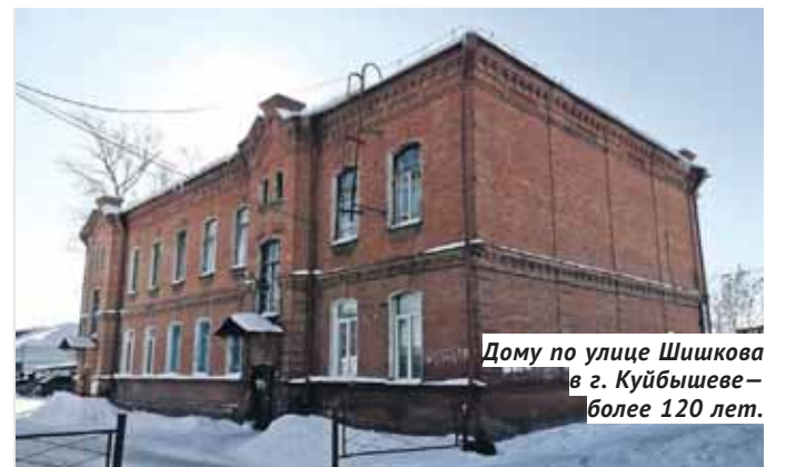
Дому по улице Шишкова в г. Куйбышеве — более 120 лет.