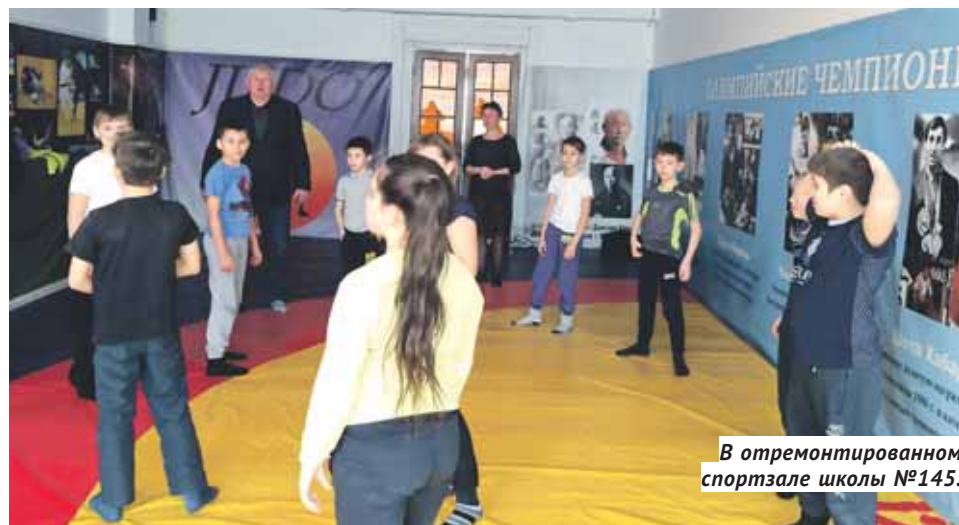
В отремонтированном спортзале школы №145.