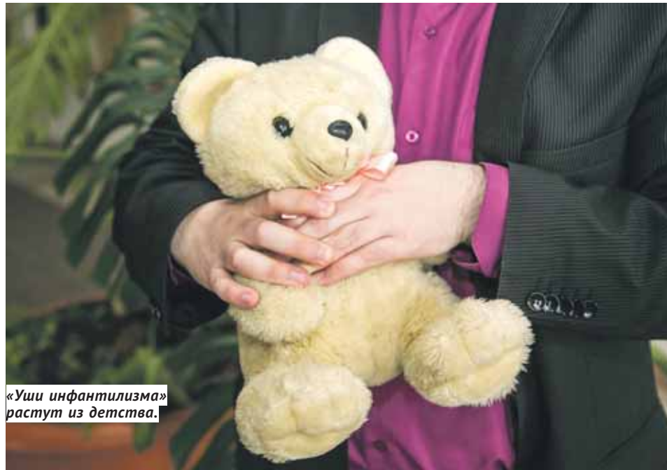
«Уши инфантилизма» растут из детства.

В последнее время в обществе стало модно быть «ребёнком» — непосредственным, эмпатичным, творческим. Но клинический психолог считает, что мы слишком романтизируем образ «питера пена»: дети в массе своей жестоки и деспотичны, они не понимают следствия собственных поступков из-за того, что не несут за них от-