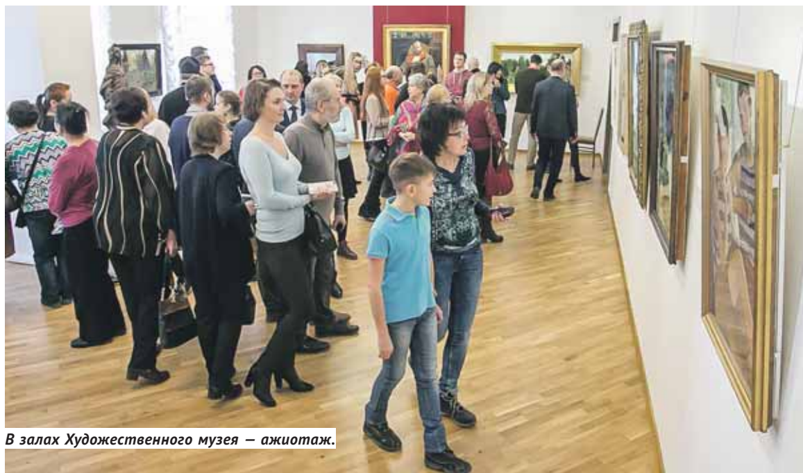
В залах Художественного музея — ажиотаж.

Тридцать три картины и две скульптуры — главная галерея страны привезла в столицу Сибири свои шедевры.